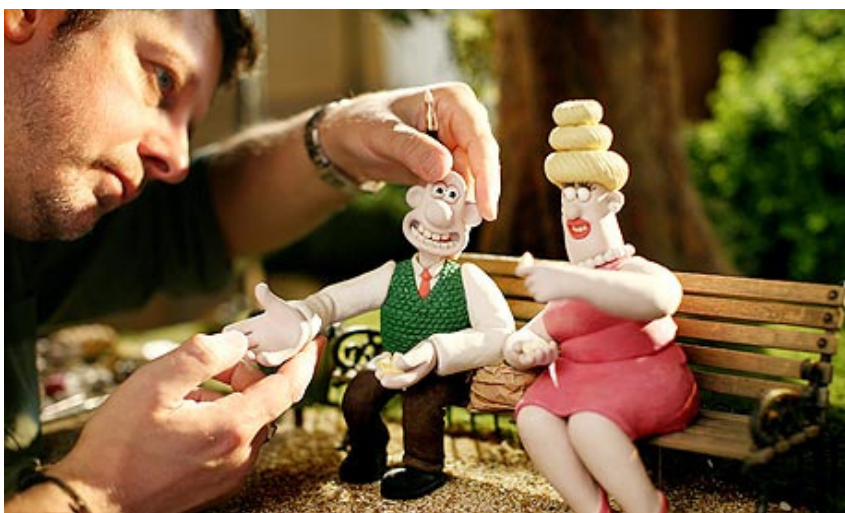
Técnica de Stop Motion